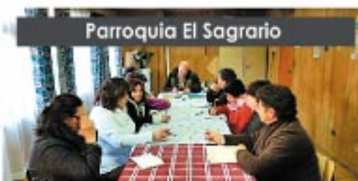
Parroquia El Sagrario