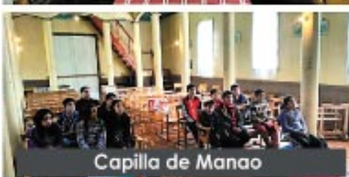
Capilla de Manao