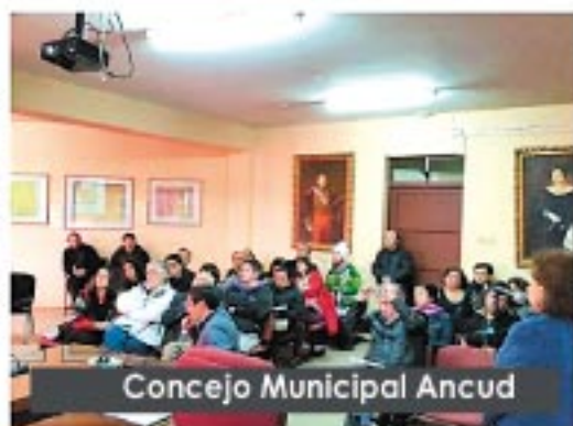
Concejo Municipal Ancud

Continuamos acompañando a los adultos mayores de la comuna de