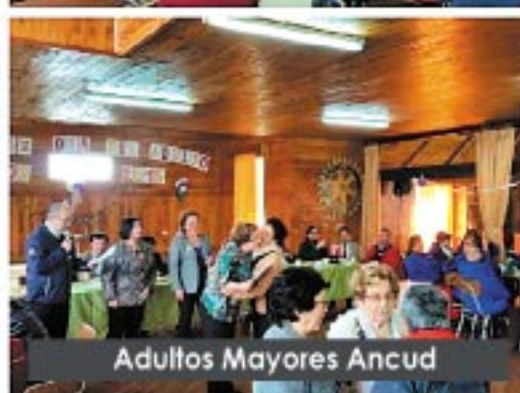
Adultos Mayores Ancud