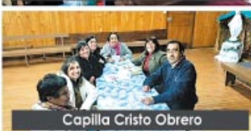
Capilla Cristo Obrero

Ancud en su día Nacional donde premiaron a varios adultos mayores y al voluntariado por su participación y compromiso.