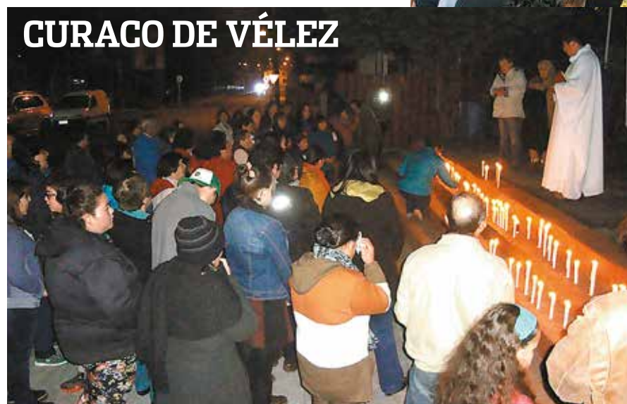
CURACO DE VÉLEZ

de la explotación del mar, lo que hoy se pide y necesita no es una limosna para enfrentar la crisis, sino el debido aporte digno que todo chileno afectado por una catástrofe tiene derecho como fruto del trabajo y de los impuestos comunes de todos los chilenos. Lo que estamos viviendo es muy semejante a un "terremoto social y silencioso" que ha derribado las fuentes de trabajo y de sustento de miles de familias, y se clama por la ayuda de la nación a partir de la responsabilidad que le corresponde al gobierno actual.