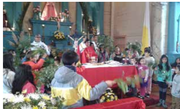
Parroquia San Juan Pablo II de Nercón