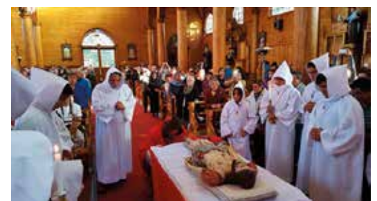
Celebración en el Templo San Francisco, Parroquia Apóstol Santiago de Castro.