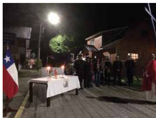
Estación del camino del Vía Crucis en la comunidad de Melinka.