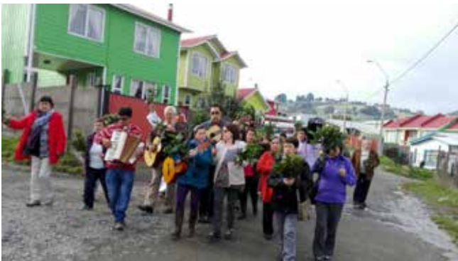
Comunidad de Fátima, Parroquia El Sagrario de

Día en que celebramos la entrada de Jesús en Jerusalén. El Rey del mundo viene a visitarnos, en este día también se realiza la tradicional bendición de los ramos.