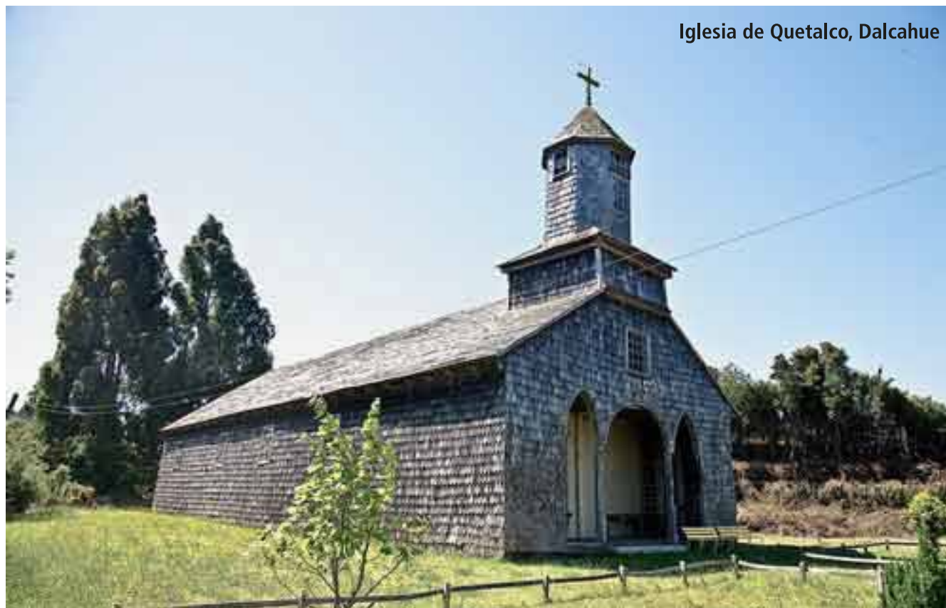
Iglesia de Quetalco, Dalcahue

El edificio fue un importante lugar de congregación de la ciudad tras el terremoto de mayo de 1960. La actual construcción vino a reemplazar al anterior templo de dos torres que se ubicaba en las inmedia-