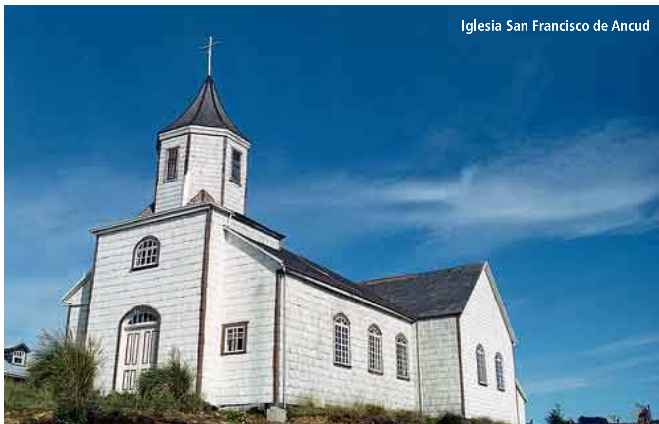
Iglesia San Francisco de Ancud