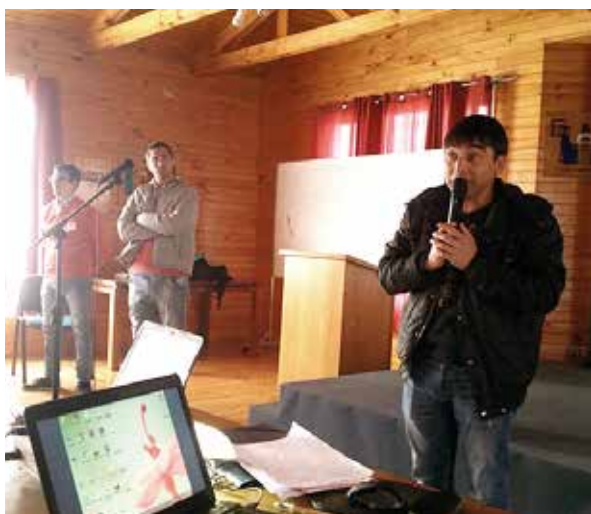
Jóvenes de la Fazenda de la Esperanza