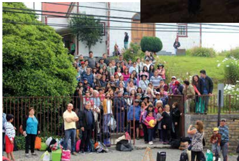
Peregrinos de Ancud