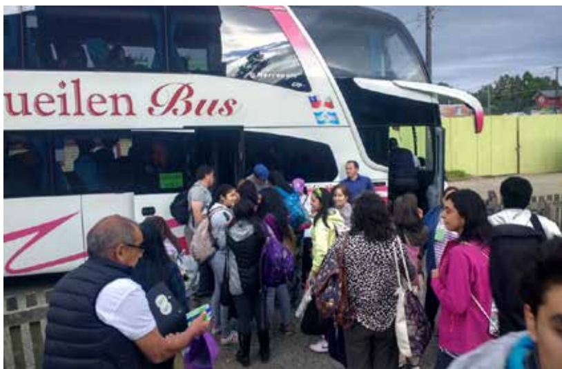
Peregrinos saliendo desde Castro