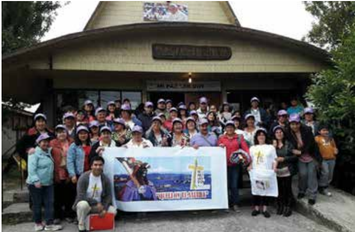
Peregrinos de Quellón

El distintivo que eligió el gran grupo diocesano fue un jockey de color morado, color símbolo de la devoción más querida de esta Tierra chilota: Jesús Nazareno de Caguach. Finalmente el verdadero dueño de esta gran fiesta es nuestro Señor, Él nos reúne, Él nos convoca, Él es quien nos envió el Papa para anunciar su Palabra. Es Jesús quien nos pide que seamos instrumentos de paz, de unidad, que seamos luz en medio del mundo, muchas veces oscurecido por el desamor, la injusticia, la violencia. Nos queda la tarea, después de haber vivido esta maravillosa experiencia, llegar a nuestros hogares y nuestras comunidades y hacer vida lo que escuchamos del Santo Padre.