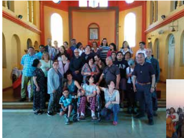
Peregrinos Zona Cordillera