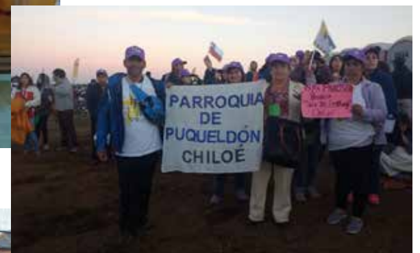
Parroquia de Puqueldón