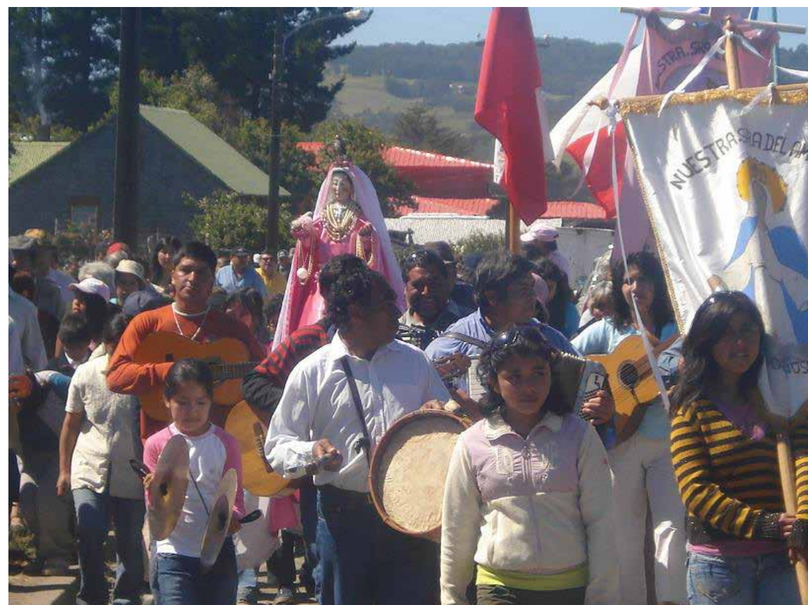
Manifestaciones de la Religiosidad Popular