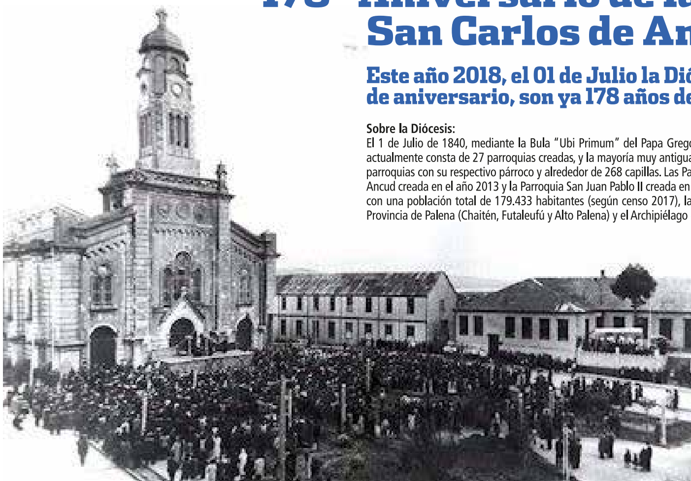
Antigua Catedral de Ancud

El 1 de Julio de 1840, mediante la Bula "Ubi Primum" del Papa Gregorio XVI, fue creada la Diócesis San Carlos de Ancud, actualmente consta de 27 parroquias creadas, y la mayoría muy antiguas, pero que en la actualidad se han reagrupado en 19 parroquias con su respectivo párroco y alrededor de 268 capillas. Las Parroquias más jóvenes son la Parroquia Buen Pastor de Ancud creada en el año 2013 y la Parroquia San Juan Pablo II creada en el año 2014. La extensión territorial es de 24.941 Km² con una población total de 179.433 habitantes (según censo 2017), la cual abarca la Provincia de Chiloé, 3 comunas de la Provincia de Palena (Chaitén, Futaleufú y Alto Palena) y el Archipiélago de las Guaitecas.