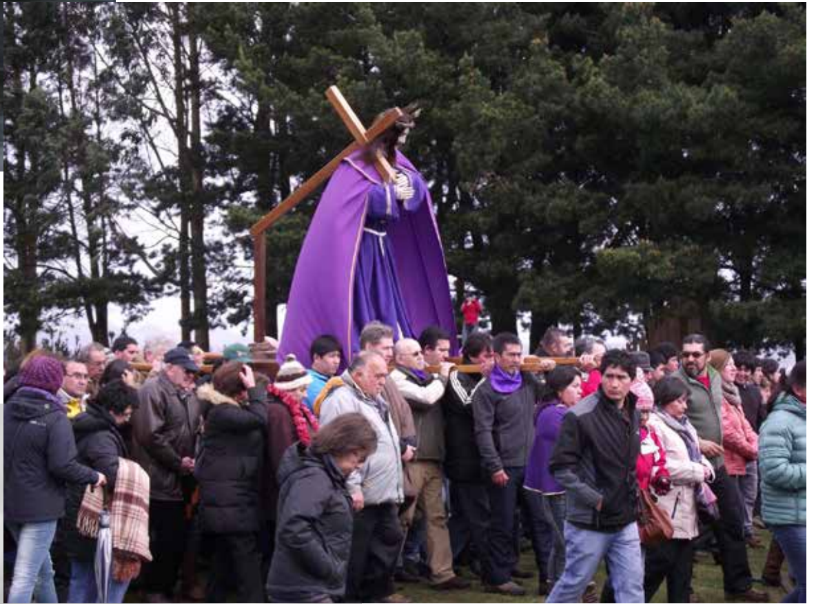
Fiesta de Jesús Nazareno de Caguach