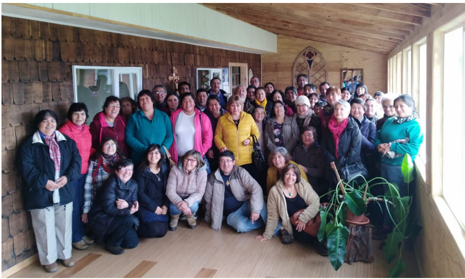
Los Fiscales (encuentro mayo 2019)