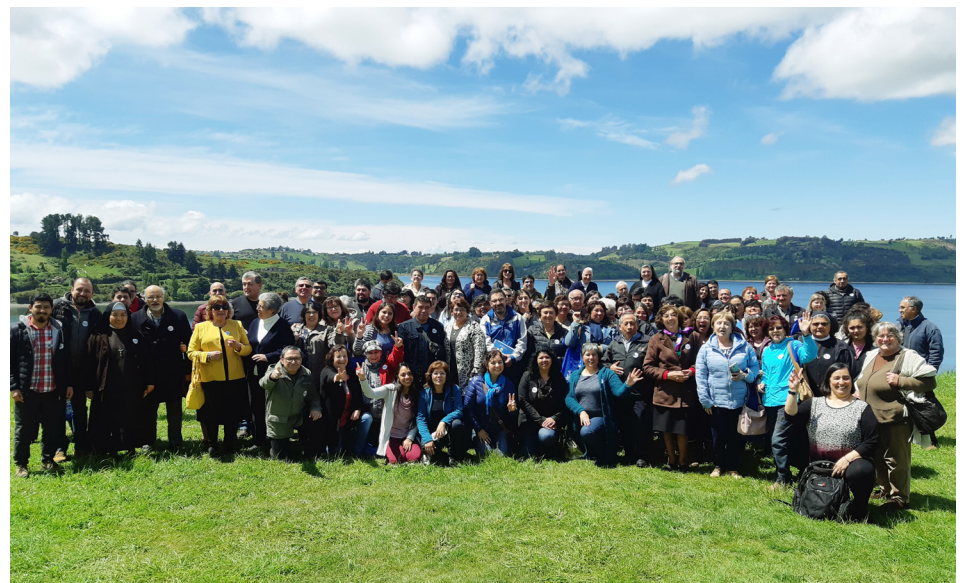
Asamblea diocesana noviembre 2018