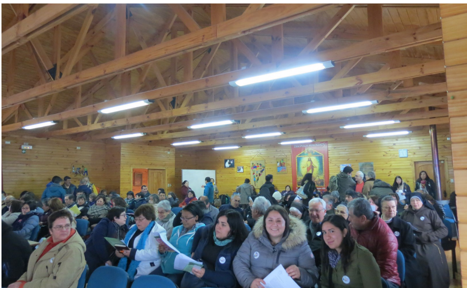
Asamblea diocesana junio 2018