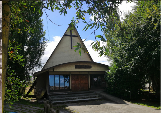
Actual Templo sede parroquial