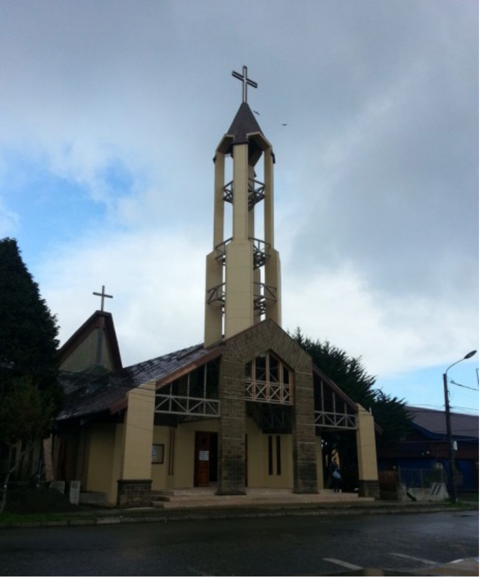
Catedral actual de Ancud