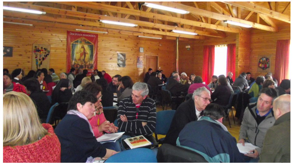
Asamblea diocesana 2013