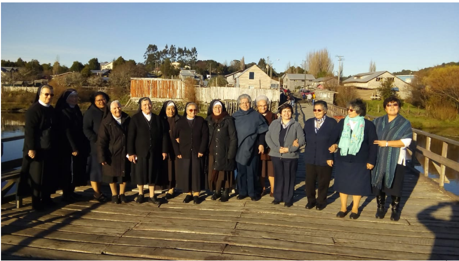
Religiosas (encuentro CONFERRE Junio 2019)