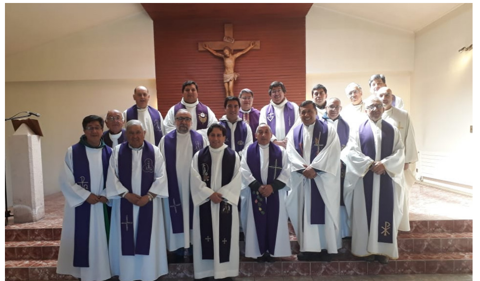
Clero diocesano (retiro 2019)