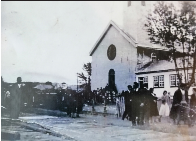
Templo Antiguo sede parroquial