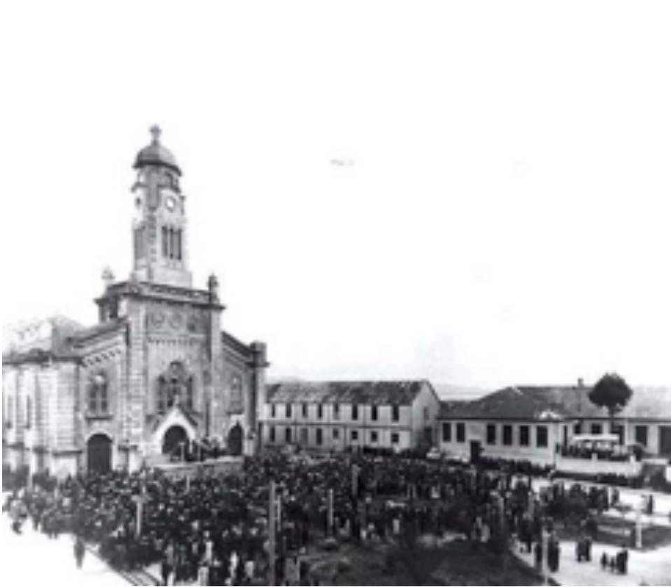
Antigua Catedral de Ancud

Según información recopilada desde las parroquias, para las estadísticas de la Santa Sede de enero a diciembre 2018, hay un total de 495 catequistas y 1070 agentes pastorales en general, que hicieron posible que hubiese durante el año: • 967 bautizos • 652 confirmaciones • 698 personas que recibieron Jesús por primera vez en la Eucaristía. • Además hubo 77 matrimonios.